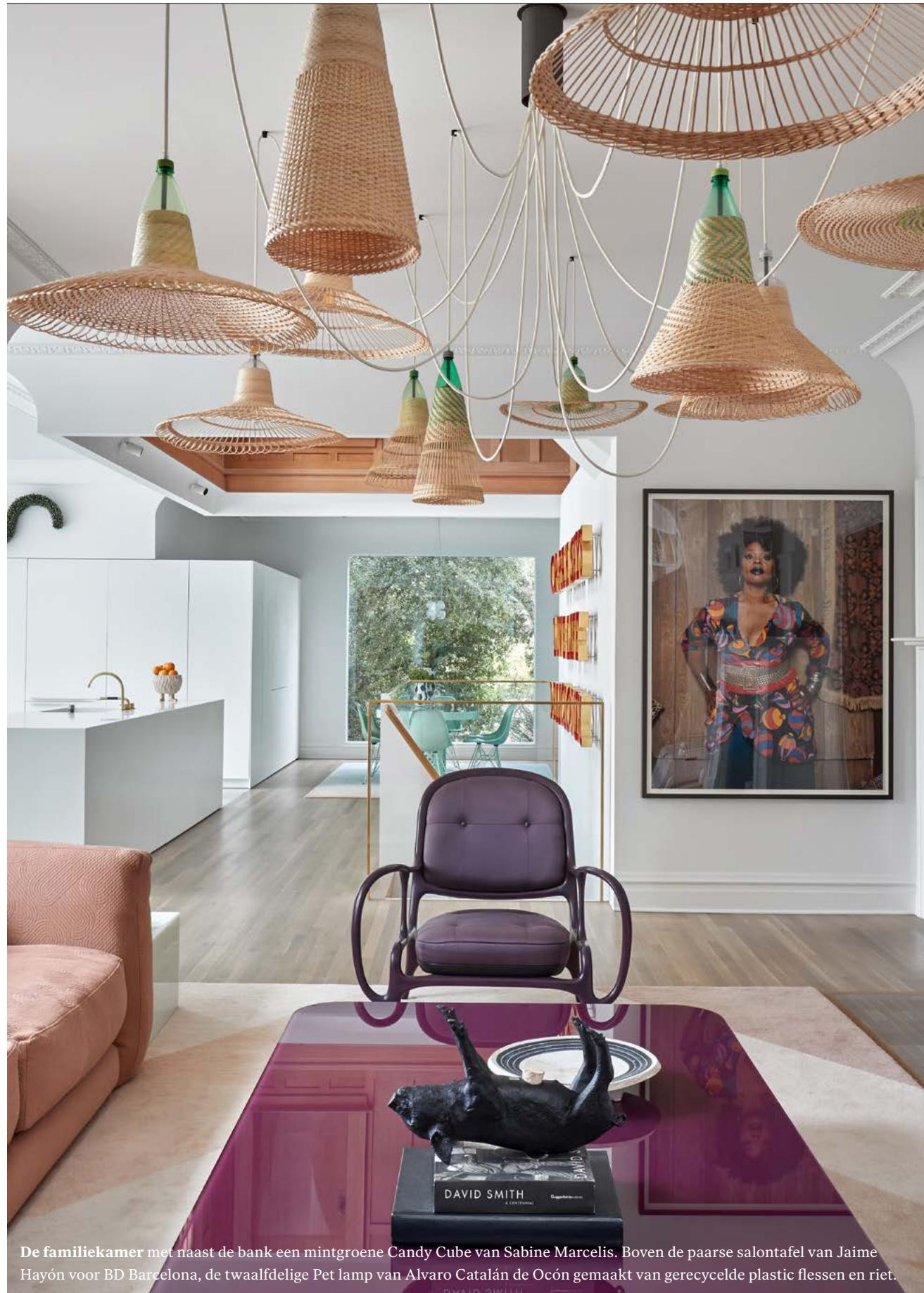
De familiekamer met naast de bank een mintgroene Candy Cube van Sabine Marcelis. Boven de paarse salontafel van Jaime Hayón voor BD Barcelona, de twaalfdelige Pet lamp van Alvaro Catalán de Ocón gemaakt van gerecyclede plastic flessen en riet.