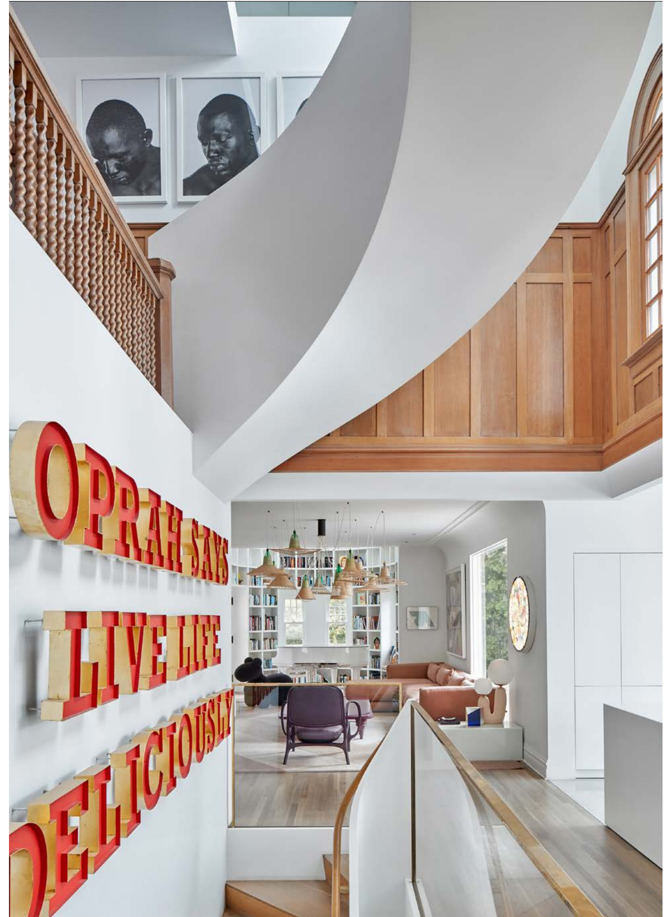
De vide boven de keuken met links het kunstwerk 'Oprah says live life deliciously' van de Zuid-Afrikaanse kunstenaar Brett Muray.