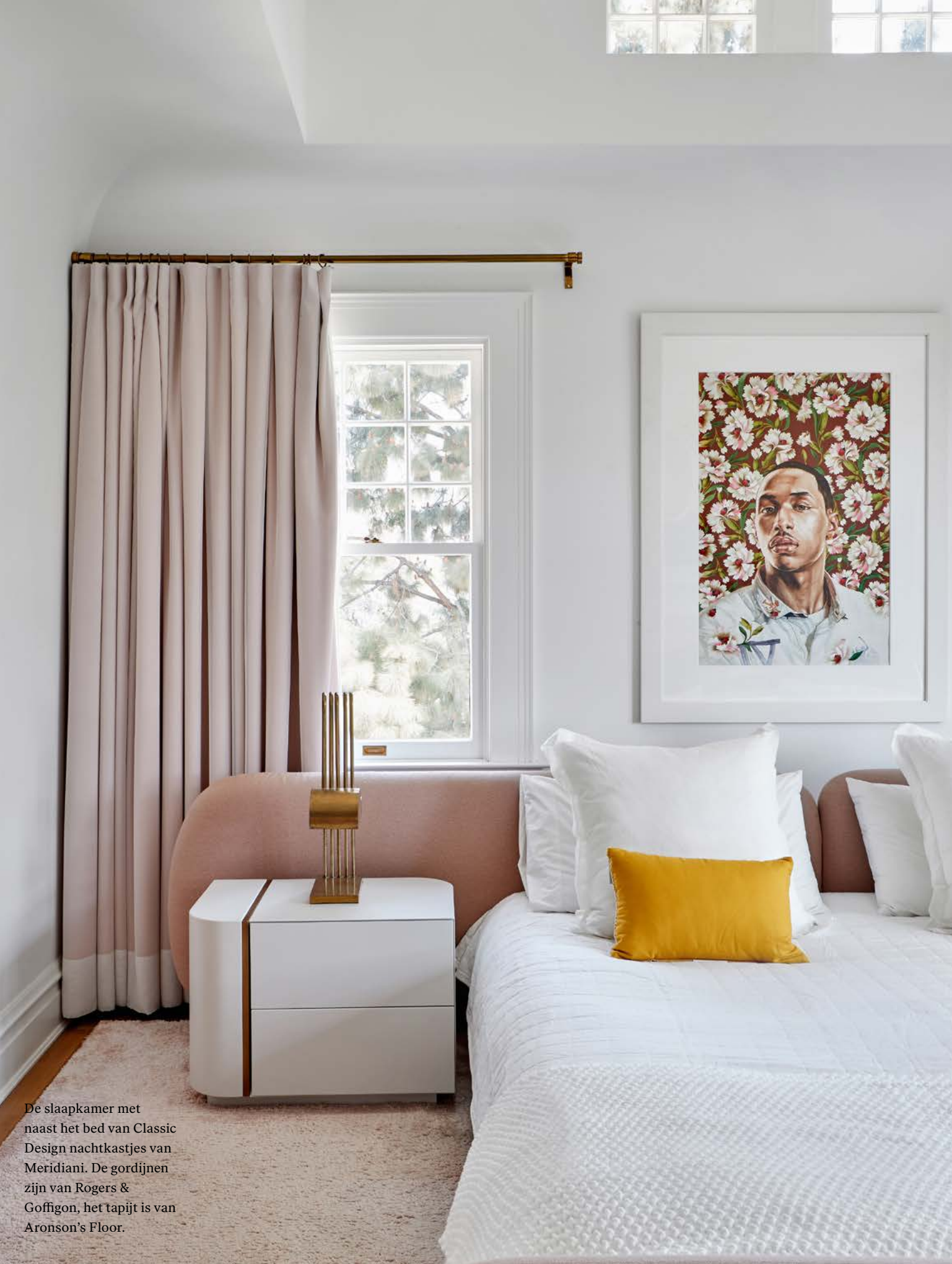
De slaapkamer met naast het bed van Classic Design nachtkastjes van Meridiani. De gordijnen zijn van Rogers & Goffigon, het tapijt is van Aronson's Floor.