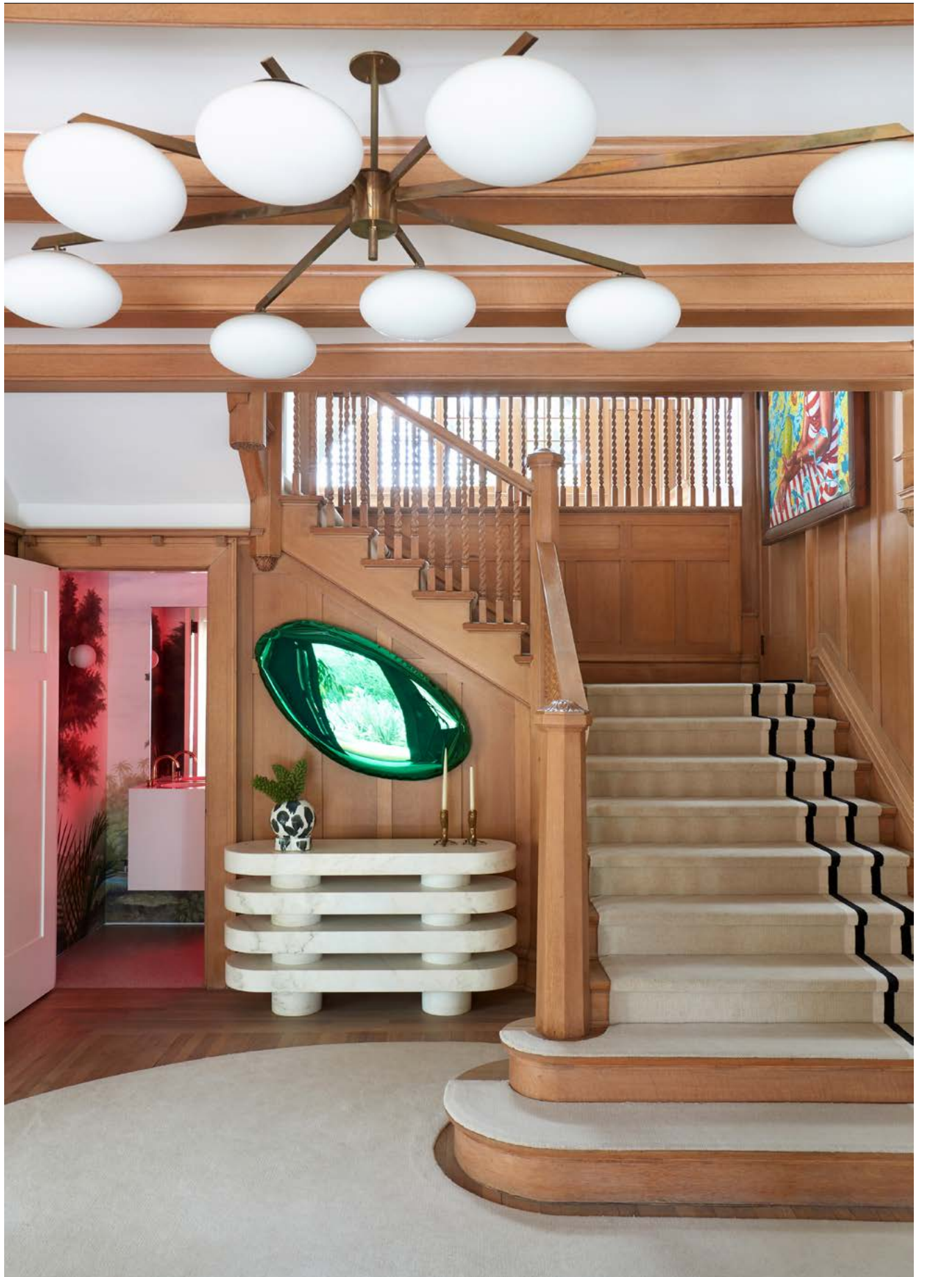
De klassieke elementen in het huis, zoals de trap, bleven bewaard en werden zorgvuldig gerestaureerd.