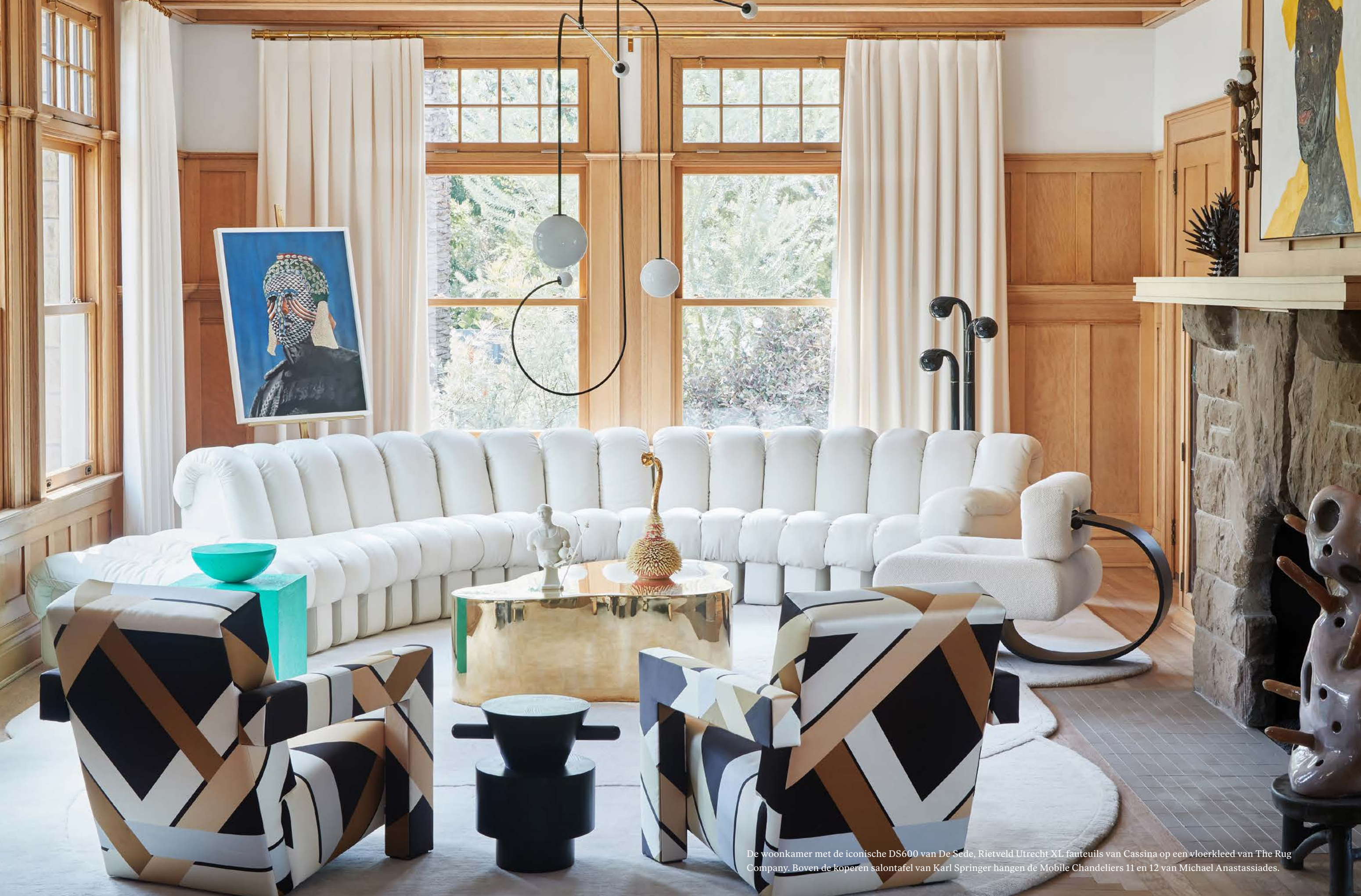
De woonkamer met de iconische DS600 van De Sede, Rietveld Utrecht XL fauteuils van Cassina op een vloerkleed van The Rug Company. Boven de koperen salontafel van Karl Springer hangen de Mobile Chandeliers 11 en 12 van Michael Anastassiades.