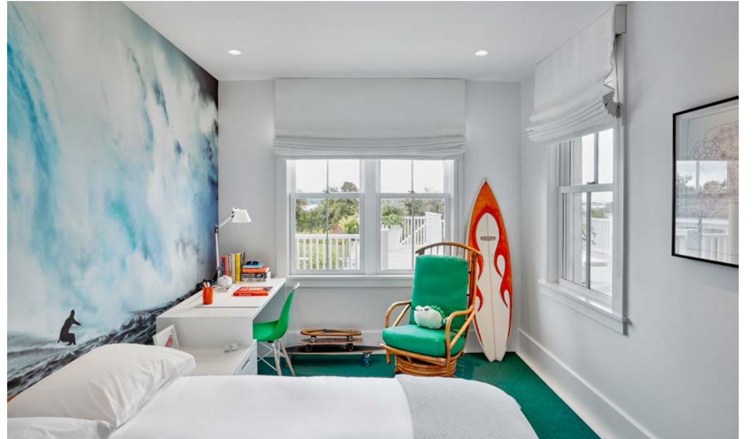
İç Mimari: GV Interiors, Mimar: Martin Sosa, Arcologica, Müteahhit: Tom O'Donoghue and Associates, Peyzaj Mimarisi: Summerhill Landscapes Inc., Aydınlatma Tasarımı: Orsman Lighting Inc.